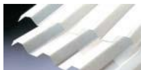
Opal Sunlux 2000PC