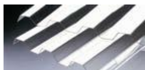
Klar Sunlux 2000PC