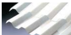
Opal Sunlux 2000PC